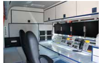
Blick auf die Funk-Arbeitsplätze im Innenraum des ELW.