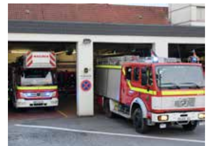
Alarm! Eile ist für die ausrückende Feuerwehr geboten.

den, wenn höchste Eile geboten ist, um Menschenleben zu retten oder schwere gesundheitliche Schäden abzuwenden, eine Gefahr für die öffentliche Sicherheit oder Ordnung abzuwenden, flüchtige Personen zu verfolgen oder bedeutende Sachwerte zu erhalten. Es ordnet an: „Alle übrigen Verkehrsteilnehmer haben sofort freie Bahn zu schaffen“.