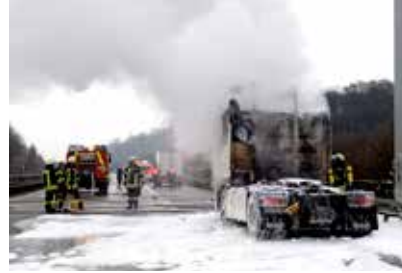
Beispiel für einen Alarm: LKW-Brand auf der A 33.

Durch die Alarm- und Ausrückordnung (AAO) ist geregelt, welche Fahrzeuge bei einem bestimmten Einsatzstichwort ausrücken und welche Meldeschleifen alarmiert werden. Nachfolgend ein Auszug aus der AAO der Feuerwehr Dissen: