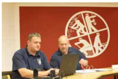
70 Meldeempfänger sind von den Funkwarten per Laptop zu programmieren und laufend zu warten.

neun tragbare Digitalfunkgeräte für die Kommunikation mit der Regionalleitstelle oder anderen Feuerwehren. Der Einsatzstellenfunk wird dann unter den eingesetzten Einsatzkräften über 18 tragbare Funkgeräte im 2-m-Band abgewickelt.