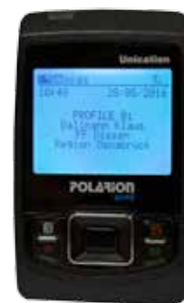
Demnächst: Der digitale Meldeempfänger mit Textnachrichten im Display.