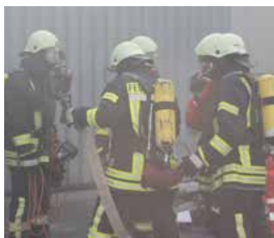
Anstrengende Arbeiten für Atemschutzgeräteträger – sie müssen körperlich fit sein.

Als ausgebildeter Atemschutzgeräteträger muss man alle drei Jahre die gesundheitliche Tauglichkeit überprüfen lassen und die sogenannte G26 Untersuchung erfolgreich absolvieren. Zudem muss man jährlich eine Belastungsprobe in einer Atemschutzstrecke absolvieren und seine praktischen Kenntnisse in einem Einsatz oder einer Übung zeigen.