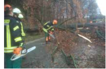
Beispiel für einen Einsatz: Umgestürzter Baum auf der Langen Straße.

In § 38 der Straßenverkehrsordnung (StVO) heißt es dazu: „Blaues Blinklicht zusammen mit dem Einsatzhorn darf nur verwendet wer-