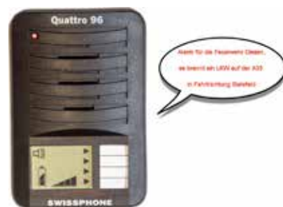
Bisher: Der analoge Meldeempfänger mit der Sprachdurchsage.

die alle von ihnen zu programmieren sind. Dabei ist die Einteilung in unterschiedliche Meldeschleifen zu beachten (siehe auch Bericht zu den Einsatzstichworten). Manche Feuerwehrleute sind ja auch noch in anderen Hilfsorganisationen wie dem DRK oder der DLRG tätig. Damit sie nicht zwei oder gar drei Meldeempfänger tragen müssen, sind auch diese Meldeschleifen mit auf dem Meldeempfänger der Feuerwehr integriert.